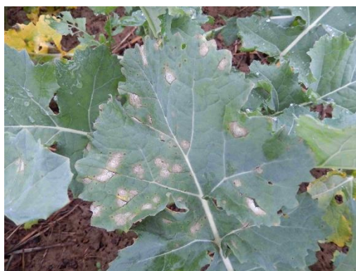
Figure 2 : Taches de phoma (taches blanches avec points noirs = pycnides) sur feuille de colza d'hiver (photo 18/11/24)

Côté maladies, quelques feuilles de colza d'hiver présentent des taches de phoma, favorisées par les conditions humides. Les variétés actuelles ont une meilleure résistance vis-à-vis de cette maladie préjudiciable, grâce à la sélection génétique.