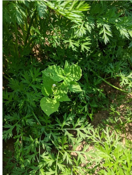
Etat de salissement d'une parcelle CTRL (11/08/2021)

En moyenne, 3,54 adventices/m 2 dans le CTRL