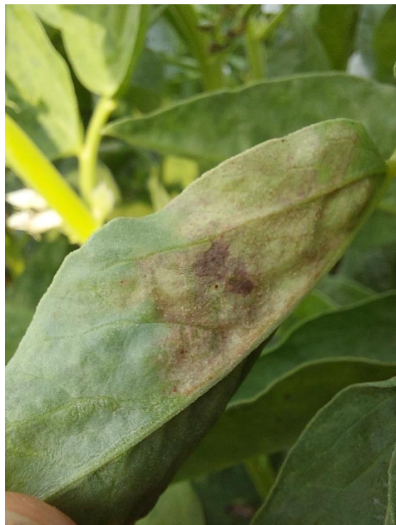
Symptômes de mildiou détectés dans l'essai le 20/07/2022.