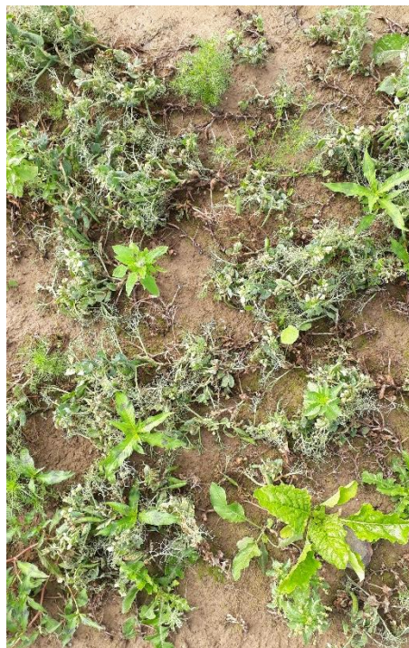
Etat de salissement d'une parcelle CTRL (11/08/2021)

En moyenne, 15,21 adventices/m 2 dans le CTRL