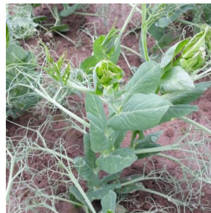
Phytotoxicité due à un traitement à base de CHALLENGE (0,5L/ha) (T6 – 16/07/21)